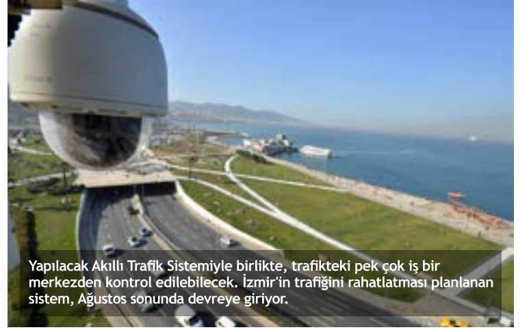
Yapılacak Akıllı Trafik Sistemiyle birlikte, trafikteki pek çok iş bir merkezden kontrol edilebilecek. İzmir'in trafiğini rahatlatması planlanan sistem, Ağustos sonunda devreye giriyor.

Bir kısmını kendi öz kaynağımızla, bir kısmını da Dünya Bankası'ndan alınan kredi ile finanse ediyoruz. Bu proje için hükümetten para alınmıyor.