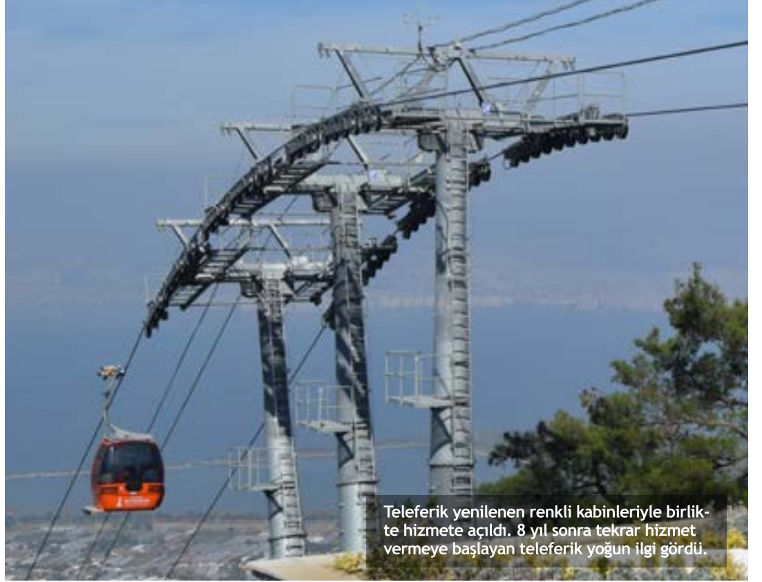
Teleferik yenilenen renkli kabinleriyle birlikte hizmete açıldı. 8 yıl sonra tekrar hizmet vermeye başlayan teleferik yoğun ilgi gördü.

fark göremedim. Mangal alanının daraldığını fark ettim. Döner restoran olarak hizmete açılmasını beklediğim bina yıkılmış, beklediğimi bulamadım. Tesis, ziyaretçi kapasitesini karşılayamayacak gibi duruyor. Sadece kabinlerin eskisine göre daha güvenli ve sağlam olduğunu fark ettim." diye konuştu.