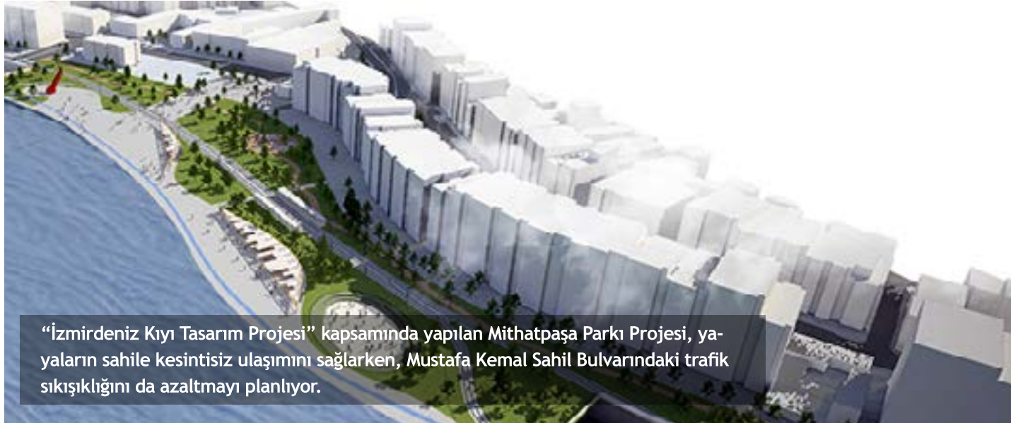
"İzmirdeniz Kıyı Tasarım Projesi" kapsamında yapılan Mithatpaşa Parkı Projesi, yayaların sahile kesintisiz ulaşımını sağlarken, Mustafa Kemal Sahil Bulvarı'ndaki trafik sıkışıklığını da azaltmayı planlıyor.

Servis yolları üzerindeki 40 farklı türden ağacın, Buca'da bulunan belediyeye ait Fırat Fidanlığı'na taşındığını ve orada rehabilitasyona alındığını açıklayan İzmir Büyükşehir Belediyesi, projenin uygulanacağı alan üzerindeki orta refüjde bulunan 44 palmye ağacınınsa İnciraltı Kent Ormanı'nda özel olarak hazırlanan alana taşınacağını açıklamıştı. Söz konusu ağaçların de taşınma işlemine başlayan Büyükşehir Belediyesi, proje bitiminde ağaçların yerlerine geri getirileceğini duyurdu.