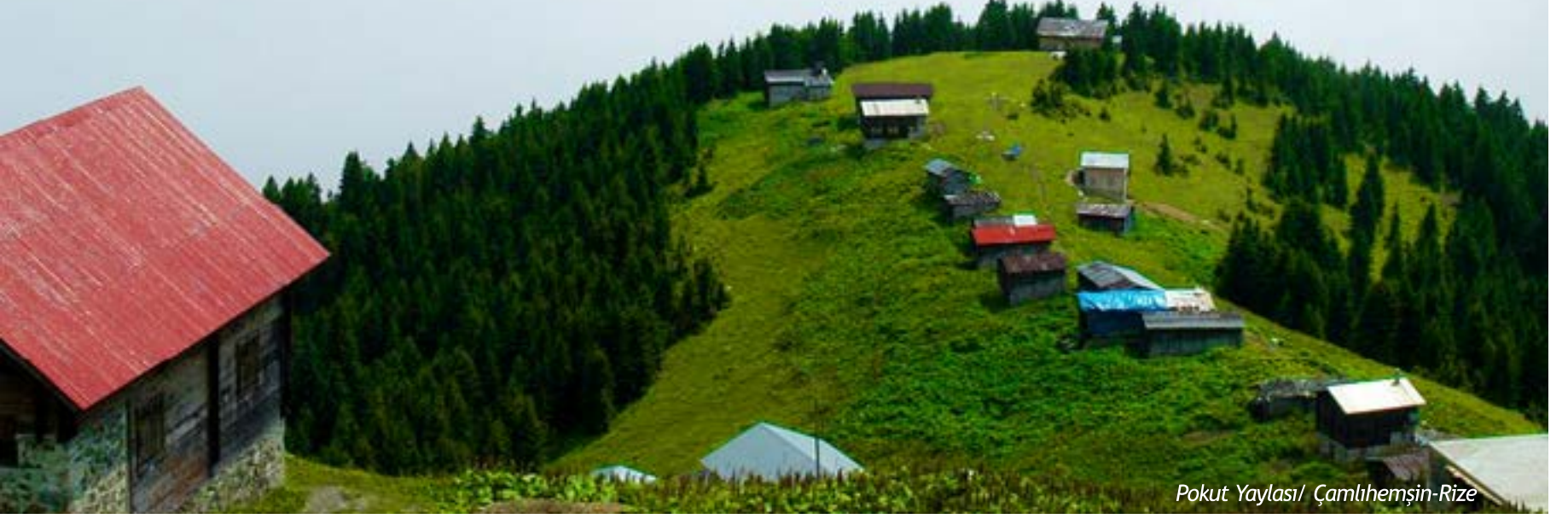
Pokut Yaylası/ Çamlıhemşin-Rize

Doğu Karadeniz'de bölgesel kalkınma ve turizmin geliştirilmesi söylemleriyle hayata geçirilmek istenen 'Yeşil Yol' projesi, kamuoyunda büyük tepki yaratıyor. Proje kapsamında yapılacak çalışmalar eleştiren Fırtına İnisiyatifi, 'Yeşil Yol'un bir rant ve imar planından ibaret olduğu, konusunda ısrarlı