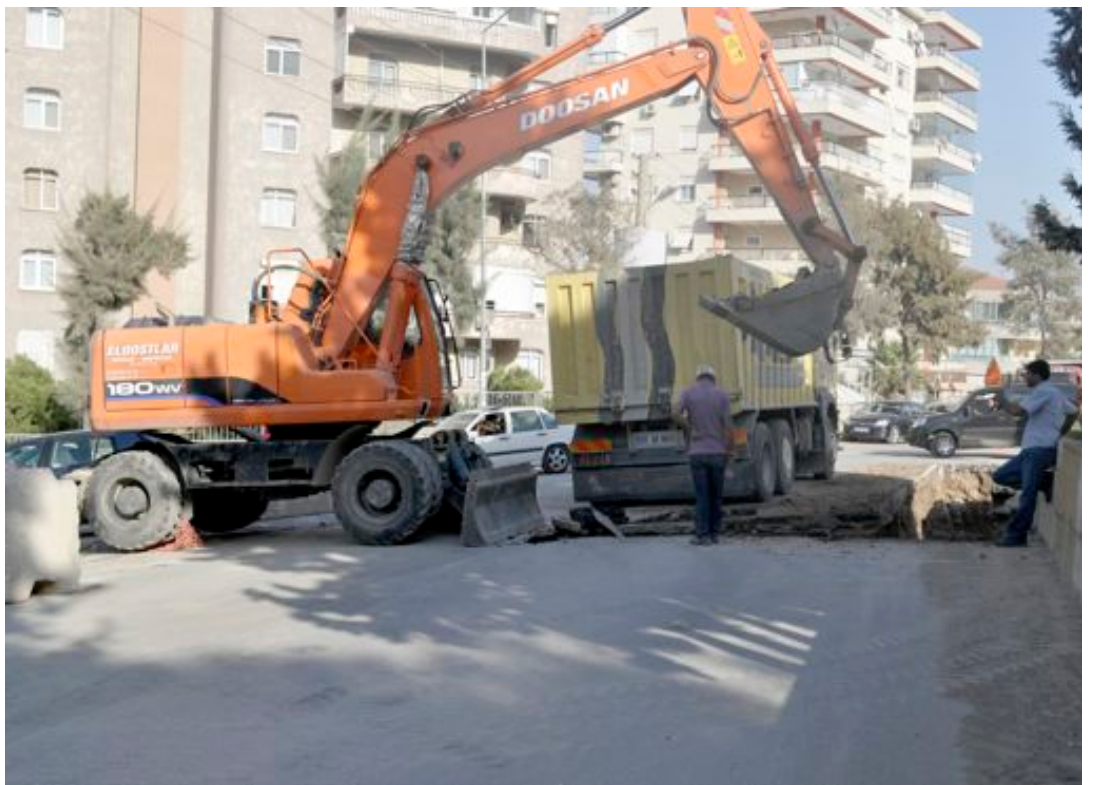
Sakarya Caddesi'ndeki yol çalışması