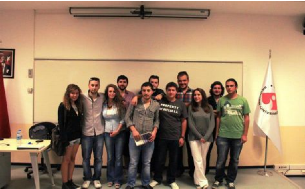
Medya kulübü yönetim kurulu ve katılan öğrenciler

Gerçekleştirdikleri önemli etkinlikler ile İEÜ ailesinin büyümesinde önemli payı olan öğrenci kulüplerine, İletişimciler tarafından bir yenisi daha eklendi